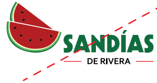
Aplicación incorrecta de la estructura

No se permite cambiar de lugar el isotipo.