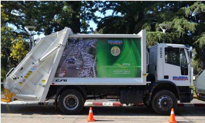
IVECO EUROCARGO, TECTOR 170 E22