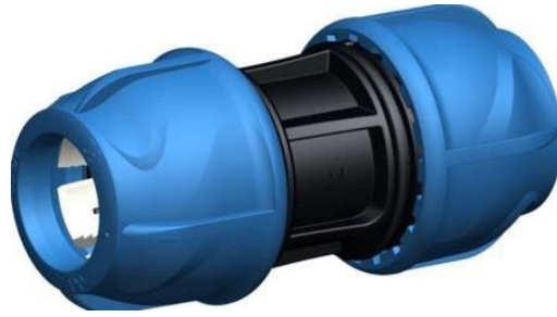
Figura 02: Tipo de conexión

Este rubro se cotizará en forma unitaria, estimando el metraje de caños a sustituir. El pago de la “Realización de conexiones” se efectuará de acuerdo con los precios unitarios establecidos en la Planilla de Rubrado en el punto 37 del presente Pliego Particular.